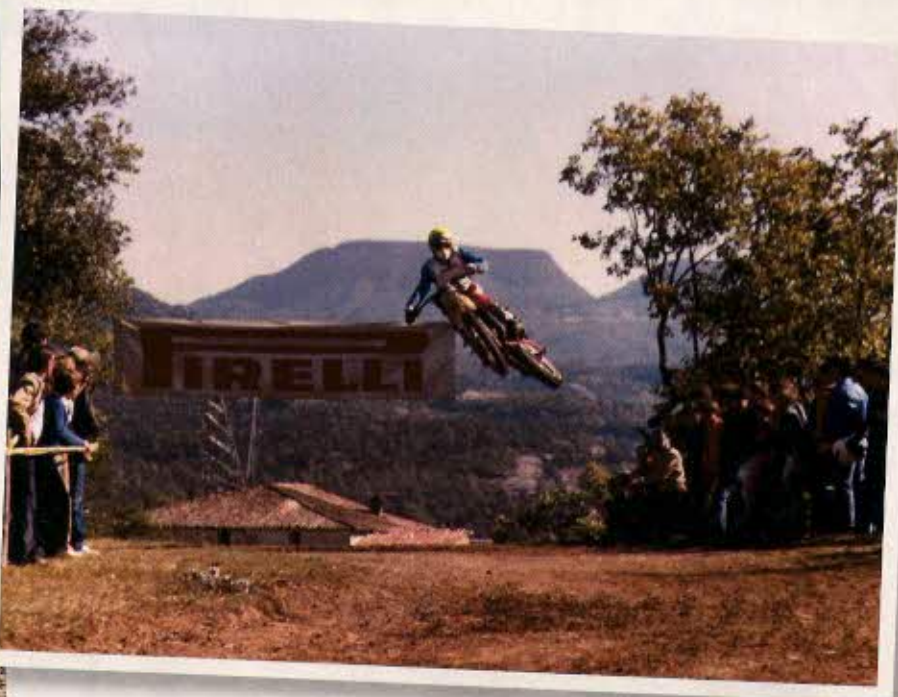
El silencioso Tecnomoto era un extra común en los ochenta. El depósito jumbo blanco cambia en la decoración respecto al de las VF. Toni Arcarons salta con el prototipo VG de depósito amarillo en una carrera de homenaje en el circuito de Somarriena, en Torelló, tras conseguir el doble campeonato de España de 250 y 500 en 1980.